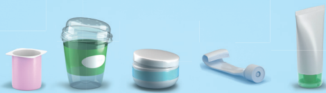
Pots et tubes