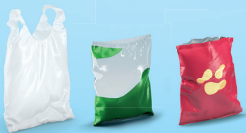
Sacs et sachets