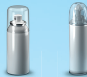
Aérosols alimentaires et cosmétiques