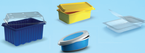
Barquettes et ravers